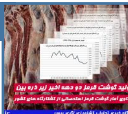
تولید گوشت قرمز در دو دهه اخیر زیر ذره بین

تطبیق داده های سری زمانی تولید گوشت قرمز از دام های سبک و سنگین در کشتارگاه های رسمی سراسر کشور با وضعیت افزایش جمعیت کشور در طی دو دهه ی اخیر نشان می دهد که میزان پرورش دام و گوشت تولیدی از مجموع دام های کشور متناسب با رشد جمعیت کشور افزایش پیدا نکرده است.