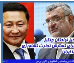
نخستین دیدار بین وزیر امور خارجه مغولستان و وزیر جهاد کشاورزی ایران

در دیدار وزیر امور خارجه مغولستان با وزیر جهاد کشاورزی کشورمان بر گسترش روابط تجاری در زمینه کشاورزی و دامپروری تاکید شد. حجتی وزیر جهاد کشاورزی در این دیدار بیان داشت: ایران می تواند بخشی از نیاز مغولستان به میگو و خشکبار را تأمین کند. وزیر امور خارجه مغولستان نیز خواستار تسهیل صادرات دام به ایران شد.