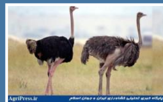
پرورش و جوشکاری