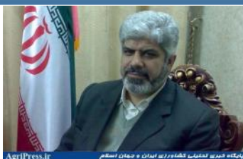
پایگاه خبری تحلیلی کشاورزی ایران و جهان

بخش کشاورزی پایه اقتصاد مقاومتی است. معتمد باید به فراهم کردن زیرساخت های کشاورزی در برنامه ششم توجه شده و در اولویت قرار گیرد.