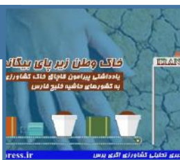
خاک وطن زیر پای بیگانگان

در مورد پدیده قاچاق خاک حاصلخیز کشور به کشورهای حوزه خلیج فارس، کارشناسان و مسئولین متعددی در طی سالیان متمادی اظهار نظر کرده اند. نظراتی که وجه اشتراک تمامی آنان محکومیت این جرم و درخواست جلوگیری از وقوع آن توسط دستگاه ها و ارگان های